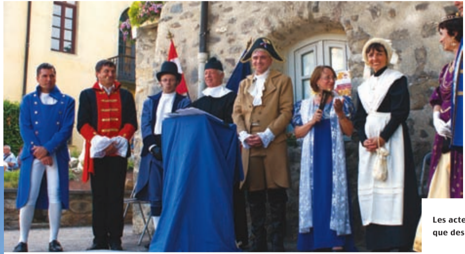
Les acteurs n'étaient autres que des élus de la vallée.

Temps fort des festivités le dernier week-end de juin à Saint-Jean-de-Maurienne, l'événement "Noces en Arc" a rencontré un beau succès avec pas moins de 5 500 spectateurs sur la seule journée du samedi. Chars, groupes de costumés, danseurs folkloriques, musiciens des harmonies de toute la vallée, spectacle son et lumières..., tous les ingrédients étaient réunis pour une belle fête populaire sous le signe du partage. Un bon nombre d'élus de Maurienne ont d'ailleurs activement participé en acceptant, sous la direction de la Compagnie Les Chariots de Thespis, de jouer une cérémonie de mariage humoristique et décalée unissant la Savoie à la France.