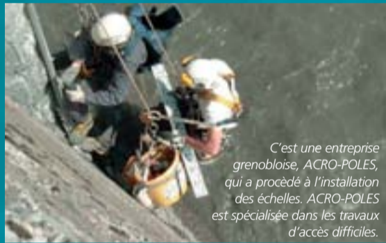
C'est une entreprise grenobloise, ACRO-POLES, qui a procédé à l'installation des échelles. ACRO-POLES est spécialisée dans les travaux d'accès difficiles.