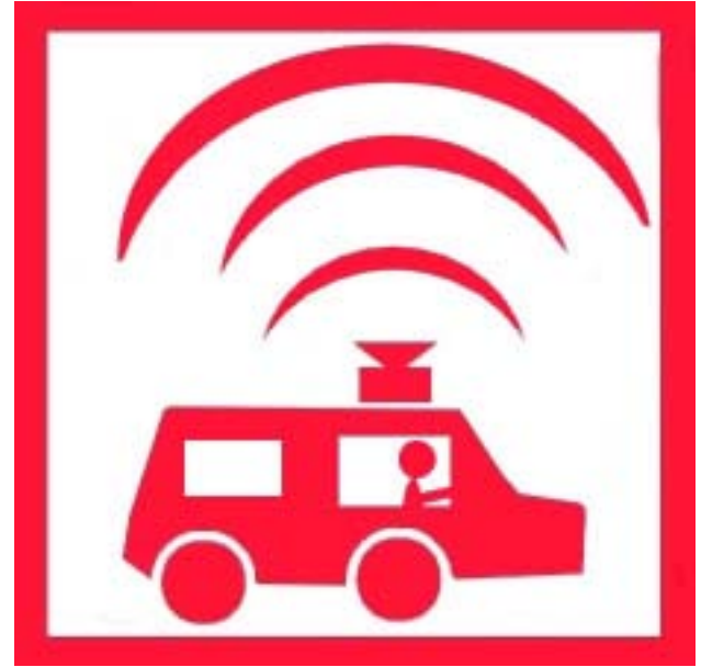
Ensemble Mobile d'Alerte (EMA)