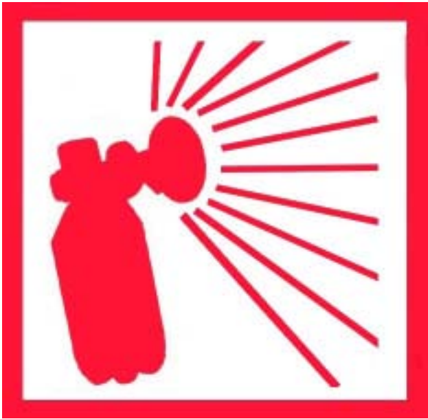
Avertisseur de Brume