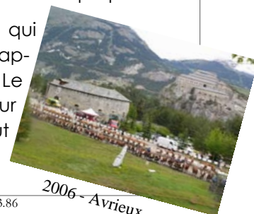
2006 - Avrieux

Néanmoins, la présence de la Fièvre Catarrhale Ovine (FCO) qui concerne le bas de la vallée et le canton de La Chambre, apporte de nombreuses contraintes (techniques et financières). Le conseil étudiera de près l'ensemble de ces conséquences sur l'organisation et jugera fin février si la présence de la FCO peut aller jusqu'à faire reporter notre comice en 2009.