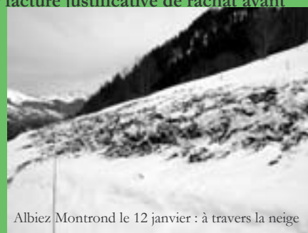
Albiez Montrond le 12 janvier : à travers la neige