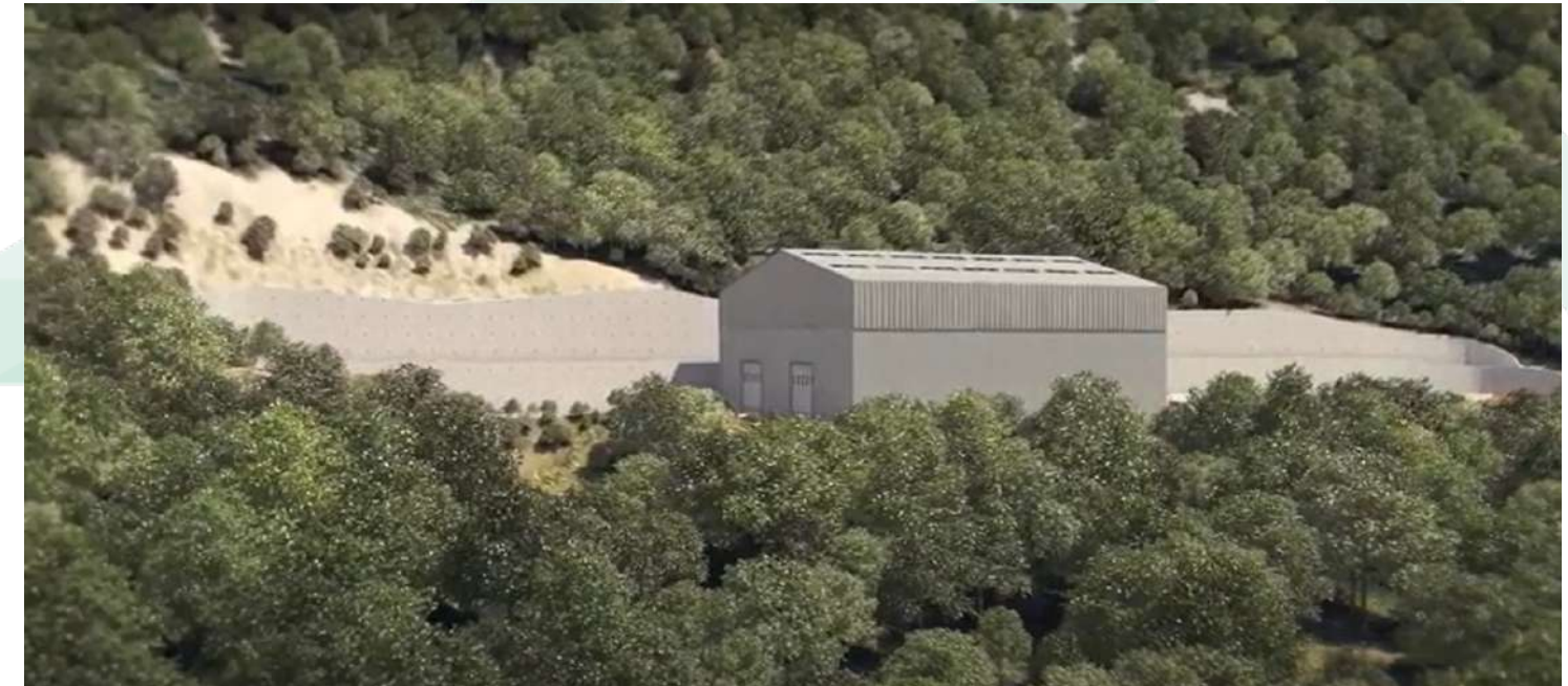
Visualisation du hangar acoustique

Dans 3 ans, le hangar acoustique sera abaissé de moitié. Il restera en place durant 6 années.