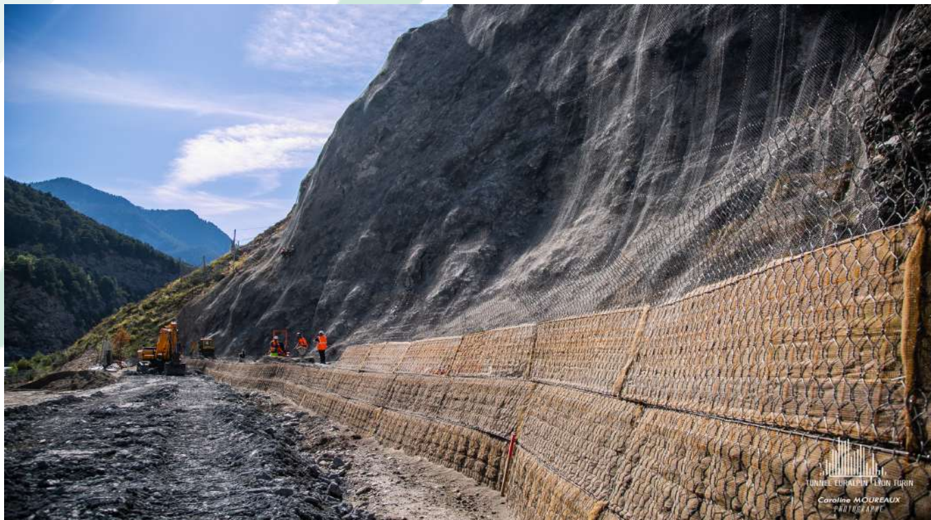
Aménagement et mise en sécurité de la plateforme supérieure de Villarodin-Bourget/Modane