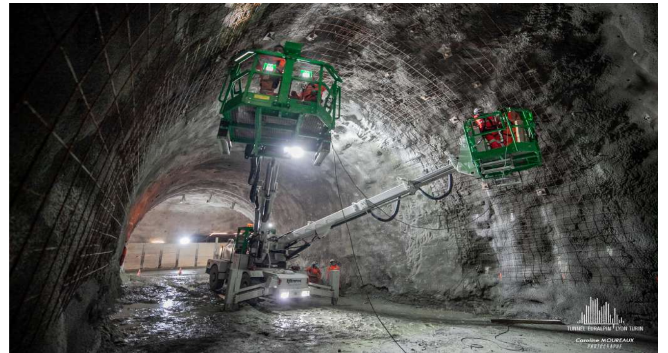
Travaux dans la galerie de connexion à la chambre de pied de puits