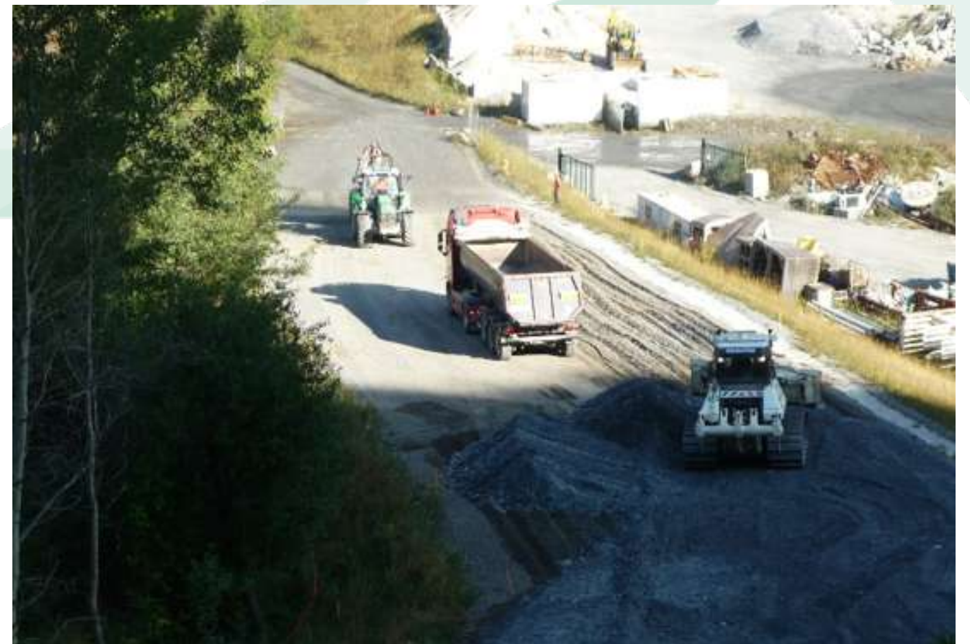
Travaux de terrassement de la section courante de la piste avec arrosage