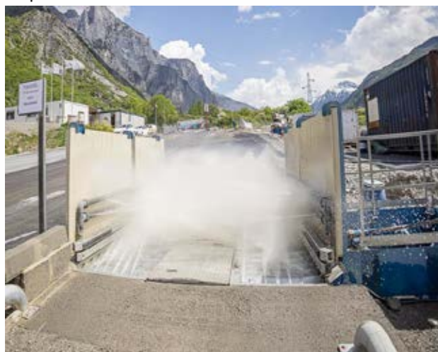
Laveur de roues dynamique