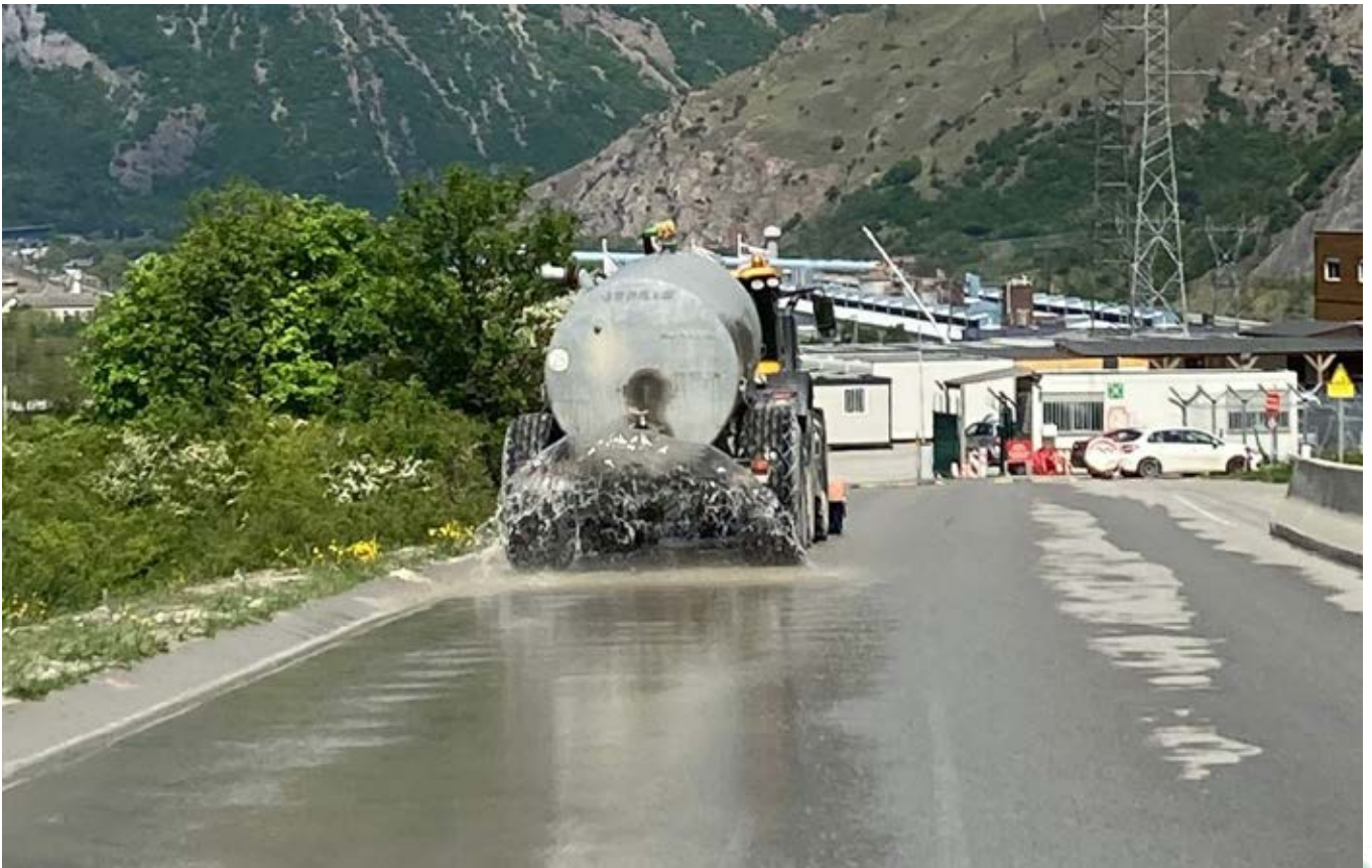
Arrosage de la voirie d'accès au chantier